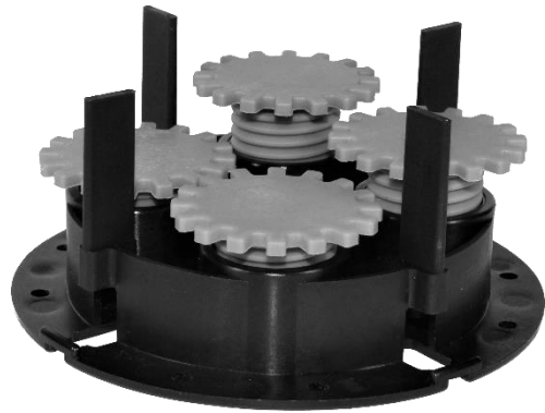
Abbildung 1: VOLFI-ZR-V-FH Zahnrad Schraub-Stelzlager (feuerhemmend)

Auch nach Plattenaufgabe geringfügig feinjustierbar, ab einer Fugenbreite von 4 mm, mit dem Fugen- und Reinigungsdraht.