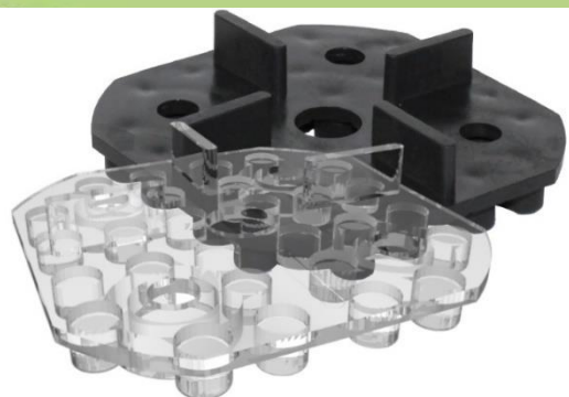
Abbildung 3: Vergleich Volfilager WK-U und TK-U

Für gleichmäßige Fugen im Wandbereich wird der Wandabstandhalter WAE-K mit Klemmnase genutzt. Zusätzlich verhindert er ein „Kippeln“ der Platten an der Wand.